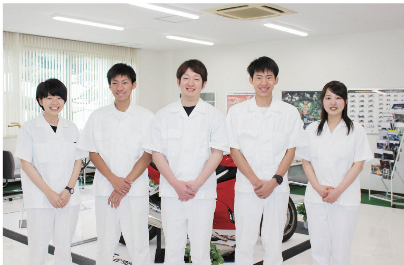
本社1階にあるオートバイのショールームで撮影。若々しい社風が根付いている同社は昨年、熊本県の「ブライ企業」平成28年度認定企業の1社に選ばれた

本田技研工業(株)の熊本進出に合わせ、合志市で創業を始めて43年。国内のみならず、海外にも4つの生産工場を持ち、熊本を代表する二輪・四輪車の部品メーカーに成長を遂げた。今後、世界市場でシェアをさらに拡大していくためのカギとなるのは、組織力の強化に向けた「GOSHI」ブランドの確立だ。