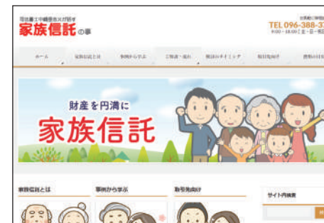
専用ホームページの開設により、家族信託の認知度が高まり、相続件数は飛躍的に増加している