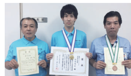
アビリンピック熊本大会では同社の3人が入賞し、1人が11月の全国大会に出場する

地方自治経営の役割分担が進展する中、建物・人材総合管理運営のリーディングカンパニーとして、「熊本城桜の馬場城彩苑」や「くまもと森都心プラザ」、「くまもと県民交流館パレア」「熊本市男女共同参画センターはあもにい」など多くの公的施設の管理運営を担っている。その実績は高く評価されており、指定管理者として再選定される各施設も多く、森都心プラザとはあもにいには2期目、八代市日奈久温泉施設は3期目となって