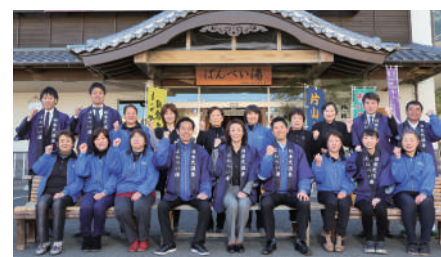
八代市日奈久温泉は指定管理者として3期目の再選定となる