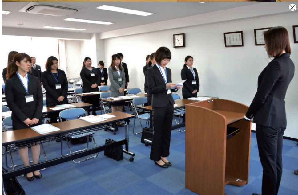
①今年2月5日に開いたくまもと森都心プラザの来館者500万人突破セレモニー。復旧工事完了に伴い4月1日から全面利用再開となった②平成29年度入社式・辞令交付式。今年は27人が新たに入社した

九綜グループは1973(昭和48)年8月、総合ビルメンテナンス事業の九州総合サービス(株)として産声を上げ、創業45周年を迎えた。熊本消毒サービス(株)、尾池管財(株)、天神ハイムビルからなる複合企業として安定経営を続けている。平成28年熊本地震から1年が経過し、創造的復興の一助となるべく、それぞれの現場で社員が一丸となって取り組んでいる。