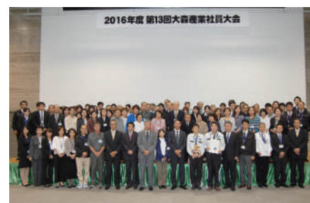
昨年実施した社員大会の様子