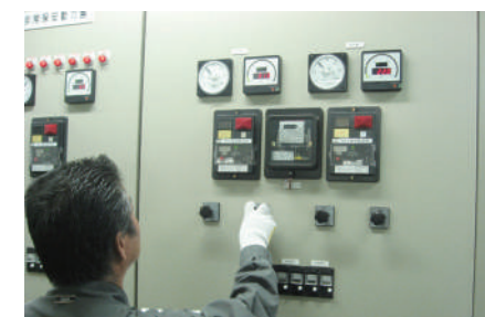
設備運転監視業務

また2015年7月29日付でISM S(情報セキュリティマネジメントシステム)の国際規格ISO27001(JISQ 27001)の認証を取得した。さらにこれに併せて、取扱う情報資産保護の重要性を認識し、情報セキュリティマネジメントシステムを構築するため、基盤となる情報セキュリティ方針も制定し、ホームページ上でも公開した。「金融機関関係などのユーザー様が